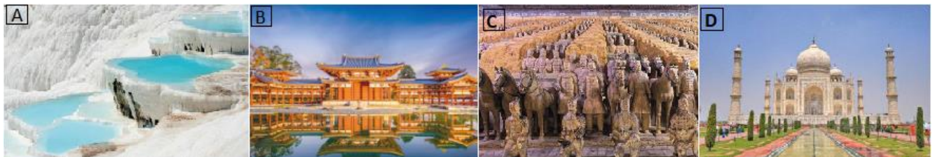
Carstul de la Pamukkale

B. Imaginile de mai jos prezintă obiective turistice renumite aflate în statele asiatice China, India, Japonia și Turcia. Scrieți pe foaia de concurs asocierea dintre imagine și statul în care se află obiectivul turistic prezentat, după modelul: E – Israel.